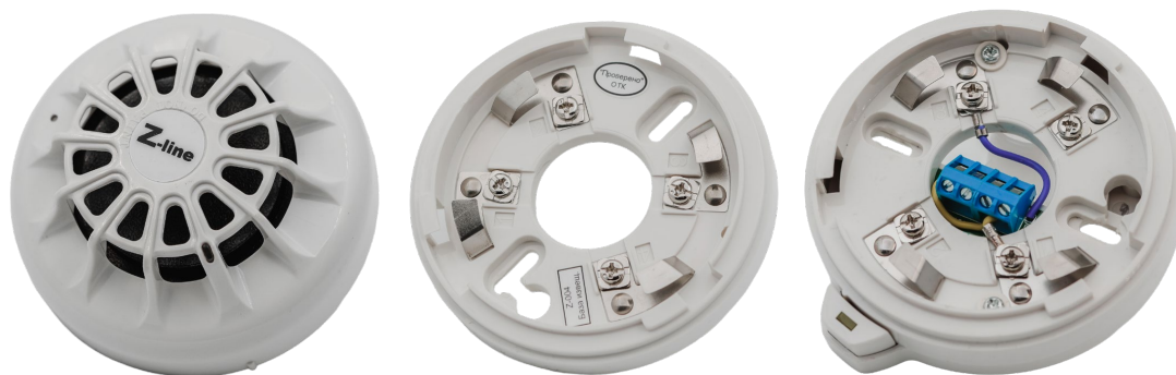
Рисунок 2.1 – Внешний вид извещателя, базы стандартной Z-004 и базы с изолятором короткого замыкания Z-005

Внешний вид извещателя и баз представлен на рисунке 2.1.