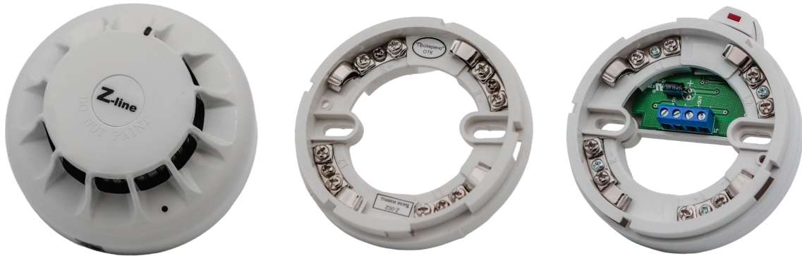
Рисунок 2.1 – Внешний вид извещателя, базы стандартной Z-002 и базы с изолятором короткого замыкания Z-003