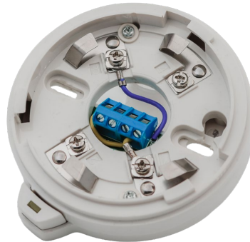
Рисунок 2.1 – Внешний вид базы с изолятором короткого замыкания Z-005

Внешний вид базы представлен на рисунке 2.1.