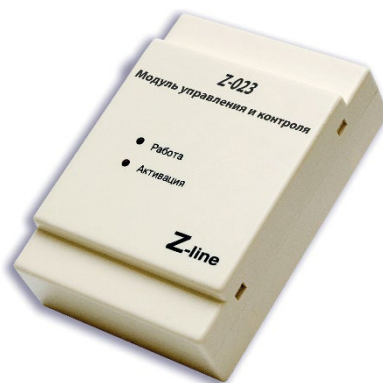
Рисунок 2.1 – Внешний вид адресного модуля ввода Z-023

Внешний вид модуля представлен на рисунке 2.1.